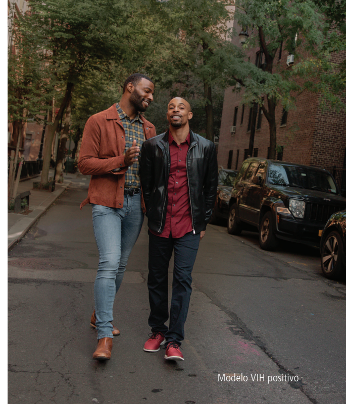
Modelo VIH positivo

TOME UNA FOTO DE ESTAS PREGUNTAS Y ANALÍCELAS CON SU MÉDICO.