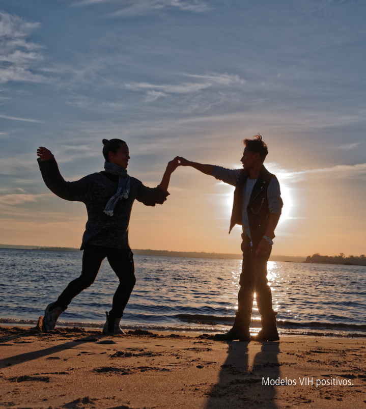
Modelos VIH positivos.