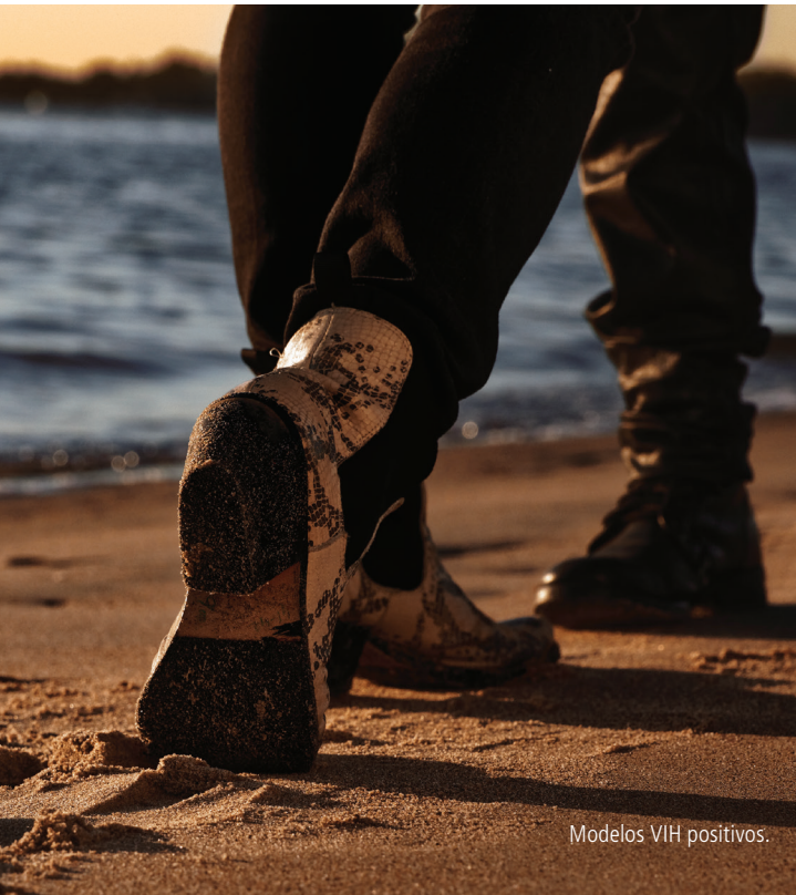
Modelos VIH positivos.